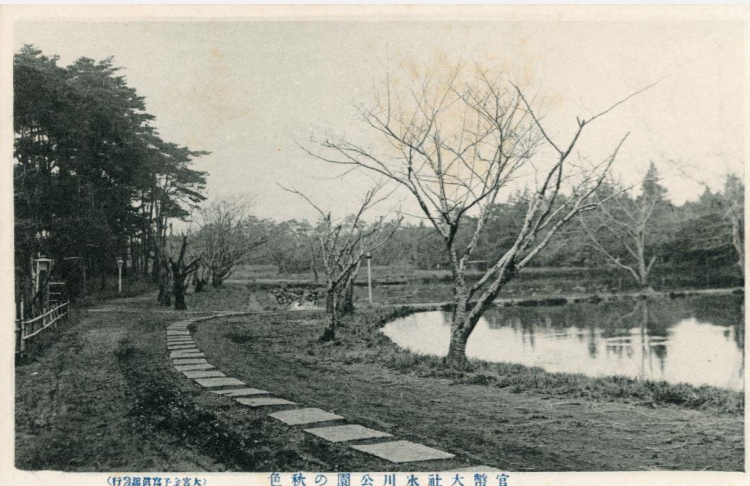
絵葉書「官弊大社氷川公園の秋色」 明治から大正ころ撮影 『青年』では「社の東側の沼の畔に出た(中略)「好い処ですね」と、覚えず純一が云った」と話すシーンがある

また、1909(明治 42)年に発表された「歓楽」では、詩人の主人公が自殺する前に作品を書き上げる場所として大宮公園を登場させています。