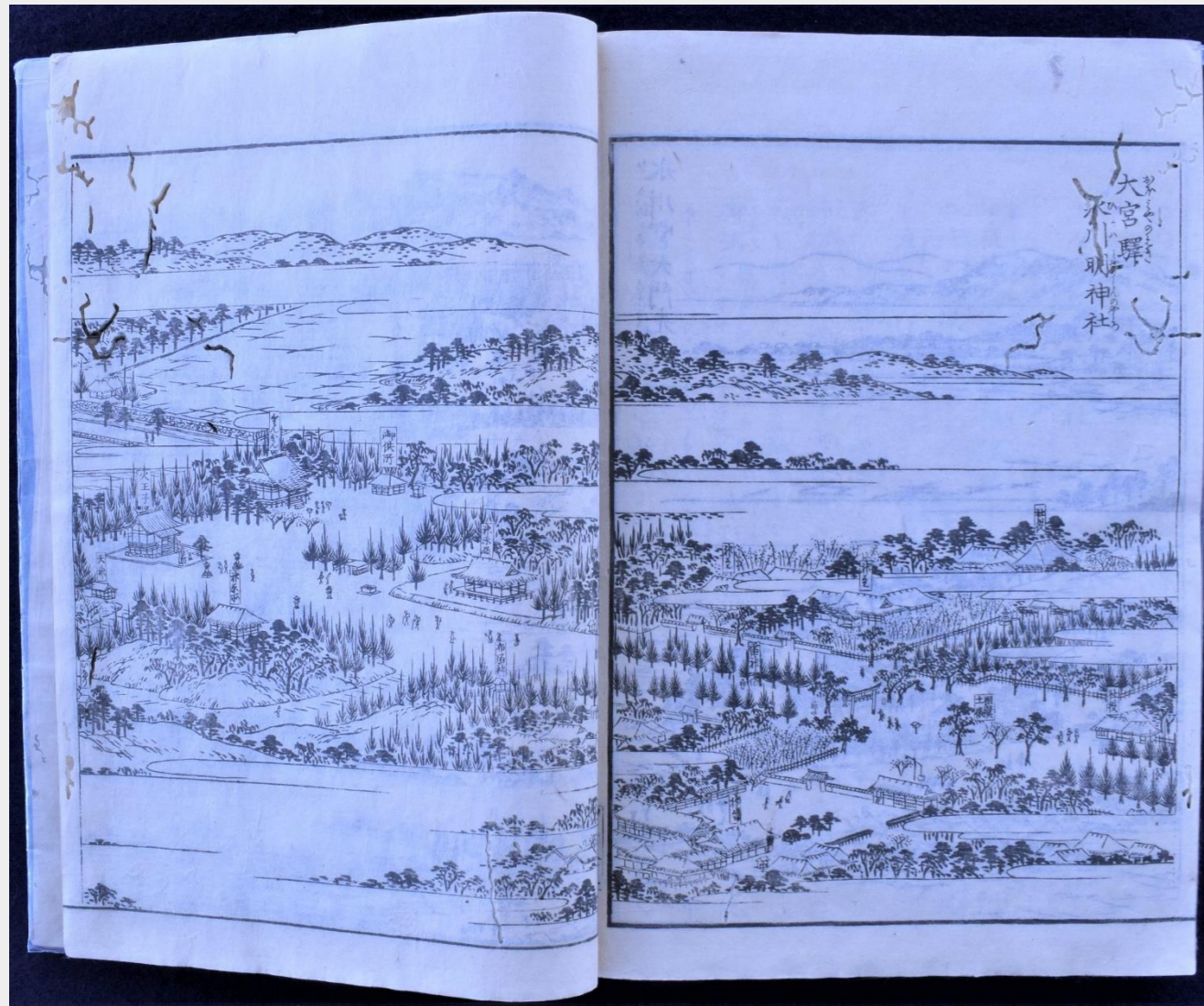
『江戸名所図会』より「大宮駅氷川明神社」1836(天保 8)年 (さいたま文学館所蔵)

明治に入ると、欧化政策を推進する政府は欧米のような公園を設置しようと、寺社の整理統合も兼ねて各地の旧寺社領の大部分を官有地としました。氷川神社境内地も、旧社領 8 万余坪(27 万 6000 m 2 )のうち、約 6 万余坪(19 万 8000 m 2 )が官有地となり、1885(明治 18)年 9 月に公園として開園します。当時の正式名称は「氷川公園」でしたが、「大宮公園」とも呼ばれていました。開園後、昭和の初期にかけて、東京や近郊から多くの人々が来園する公園として人気を集めました。その中には多くの文学者も含まれており、彼らの筆によって、大宮公園は作品の舞台としても様々に表現されてきました。