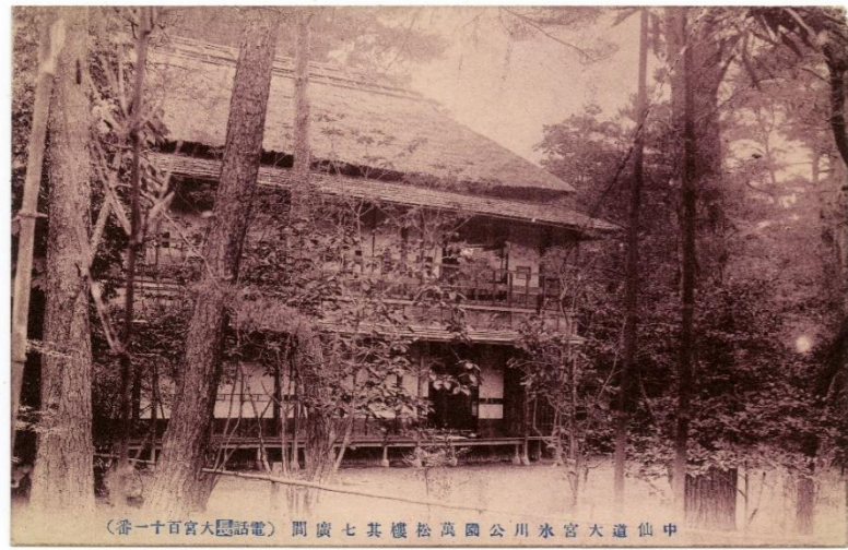
絵葉書「中山道大宮氷川公園萬松樓其七廣間」(No.7) 明治末期から大正初期ごろ撮影

大宮氷川公園 ふみこんで帰る道なし萩の原 氷川公園万松楼 ぬれて戻る犬の背にもこぼれ萩